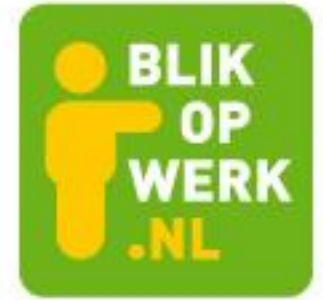
Pi5 tov GS